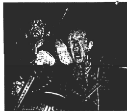
Apocalyptic throb: members of Judas Priest on stage